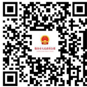
临汾市人民政府公报

主管主办单位:临汾市人民政府办公室 编辑印发单位:临汾市政府公报编辑中心 地址:临汾市解放西路市府街 电话:(0357)2091150